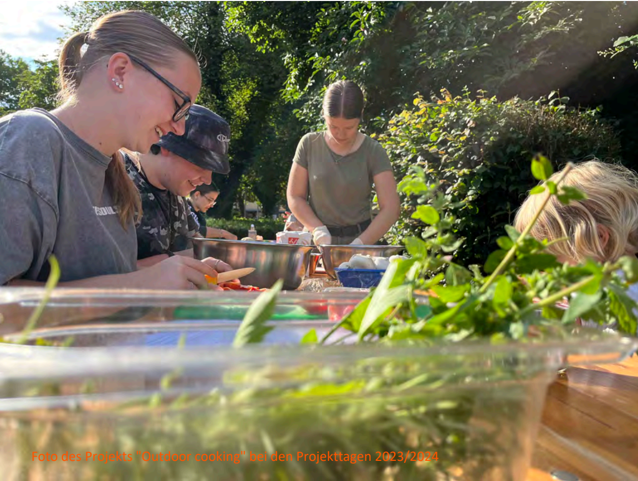
Foto des Projekts "Outdoor cooking" bei den Projekttagen 2023/2024